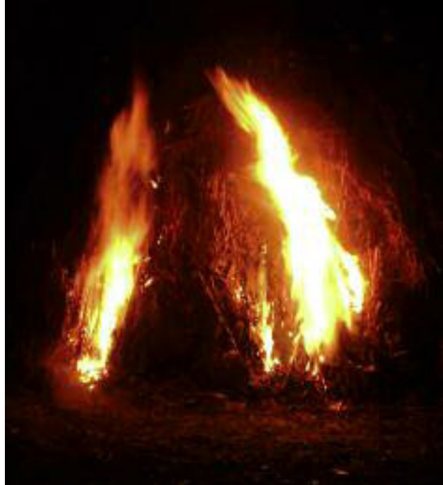
Casèra di Barco poco dopo l'accensione.

Ecco rappresentato di seguito il grafico che descrive il modello di intonazione tipico del pan e vin .