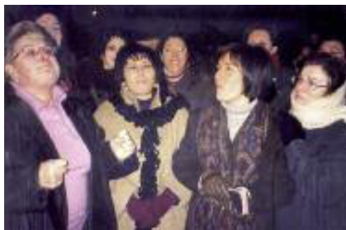
Casera Barco: Gruppo di partecipanti al rito colte nella parte iniziale dell'invocazione del pan e vin.